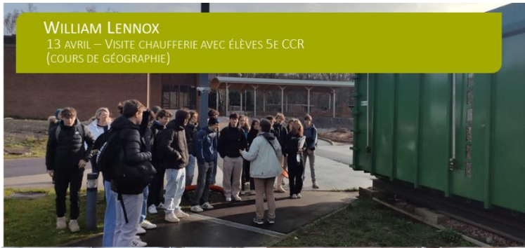
WILLIAM LENNOX 13 AVRIL – VISITE CHAUFFERIE AVEC ÉLÈVES 5e CCR (COURS DE GÉOGRAPHIE)