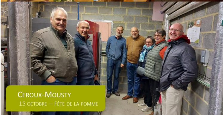
CEROUX-MOUSTY 15 OCTOBRE – FÊTE DE LA POMME