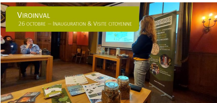
VIROINVAL 26 OCTOBRE – INAUGURATION & VISITE CITOYENNE