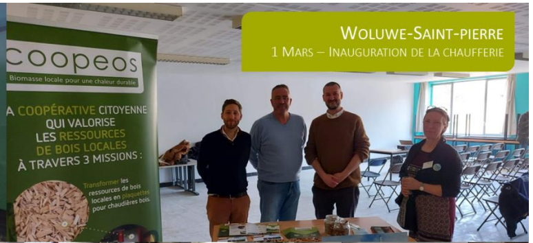
WOLUWE-SAINT-PIERRE 1 MARS – INAUGURATION DE LA CHAUFFERIE