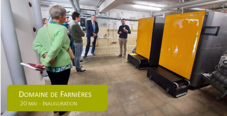
DOMAINE DE FARNIÈRES 20 MAI – INAUGURATION