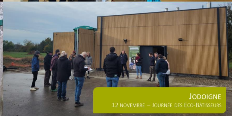
JODOIGNE 12 NOVEMBRE – JOURNÉE DES ECO-BÂTISSEURS