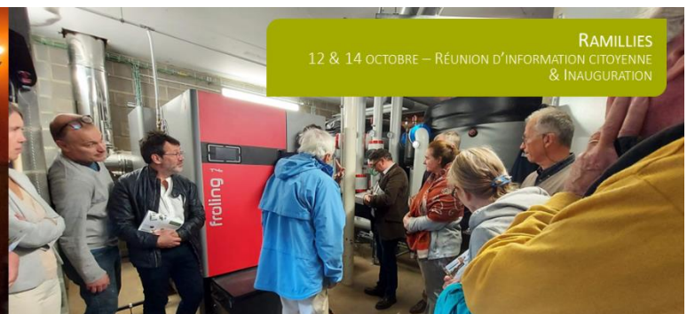
RAMILLIES 12 & 14 OCTOBRE – RÉUNION D'INFORMATION CITOYENNE & INAUGURATION