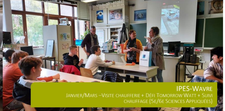
IPES-WAVRE JANVIER/MARS – VISITE CHAUFFERIE + DÉFI TOMORROW WATT + SUIVI CHAUFFAGE (5e/6e SCIENCES APPLIQUÉES)